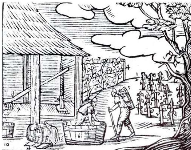
A szüretelés ábrázolása Comenius Orbis pictus c. művéből

Bethlen Gábor fejedelem 1629. november 15-én halt meg. Végrendeletén Debreczeni kézírásával olvashatjuk: „Szegény Fejedelem testamentuma”. Bethlen halála után néhány hónapig még Brandenburgi Katalin szolgálatában állt, mert 1630. január 28-án a fejedelemasszony megbízásából fejedelmi prefektusként és tizedfőarendatoroként oklevelet állított ki Gyulafehérvárra, ahol három nappal korábban összeült az országgyűlés. Ekkor temették el a fejedelmet, és minden bizonnyal a rendek ekkor érték el, hogy távozzon tisztségéből. Utódja vicearendatora, Száraz Máttyás lett. Nem tudjuk, mikor hagyta el Erdélyt, talán 1630 februárjában tért haza, hogy ott legyen Szatmár vármegye február 28-án tartott közgyűlésén, ahol őt a hét felső-magyarországi vármegye átadását, illetve visszacsatolását végző (megyei) biztosok közé választották. Március 30-ra a feladatot elvégezték, Debreczeni ezek után – ha ugyan egyáltalán személyesen részt vett benne – feltehetően egy kis időre visszatért Gyulafehérvárra, hogy személyesen érje el a fejedelemasszonynál egyes birtokaiban való megerősítését.