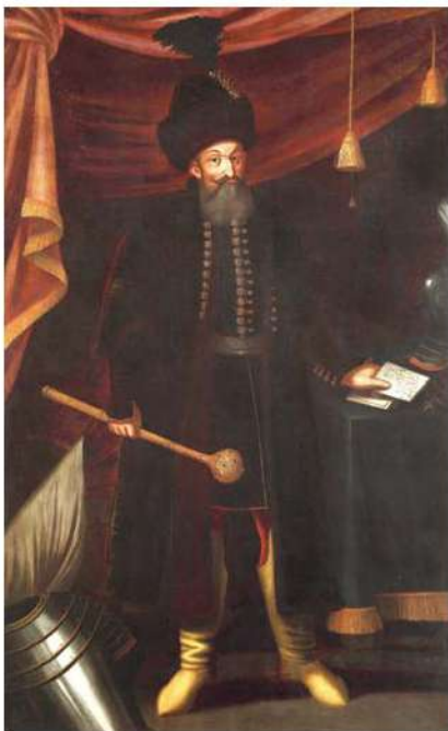
I. Rákóczi György erdélyi fejedelem (Magyar Nemzeti Múzeum, Történelmi Képcsarnok)

delta, hogy a főkapitányi teendőket sokat tapasztalt prefektusa is el tudja látni (már csak azért is, mert nem valószínű, hogy Debreczeni hadi jártassága feledésbe merült volna). A fejedelem emellett úgy gondolkodhatott, mint jeles prefektusa is általában, aki egy 1634-es levélben, ugyan mással kapcsolatosan, de a következőket írta urának: „...az mi nélkül ember el lehet, annak biában való fizetését jobb az tárbázban tartani.” A következő évek aztán bebizonyították, hogy a vár és a hozzá tartozó terület védelmének feladatait is nagyszerűen irányítja. Szervező, azon belül hadszervező tehetségét talán legjobban az 1644-45-ös nagy hadjárat előkészítése során mutatta meg, mint a magyarországi szervezőmunka fő irányítója.