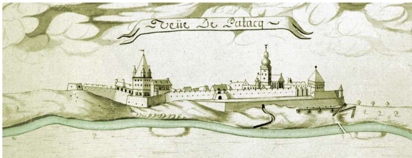
Sárospatak vára a 17. század második felében (részlet)

Debreczeni utasításokat adva irányította I. Rákóczi György birtokait, azaz az udvarbírókhoz írt levelekben elrendelte, hogy mit és mikorra kell végrehajtani. Ők pedig jelentéssel tartoztak neki. A birtokközpontnak számító Sárospatakon lakott – a várban és a városban, illetőleg a sárospataki uradalomban, valamint a Hegyalján folyó gazdálkodást közvetlenül, azaz személyesen irányította.