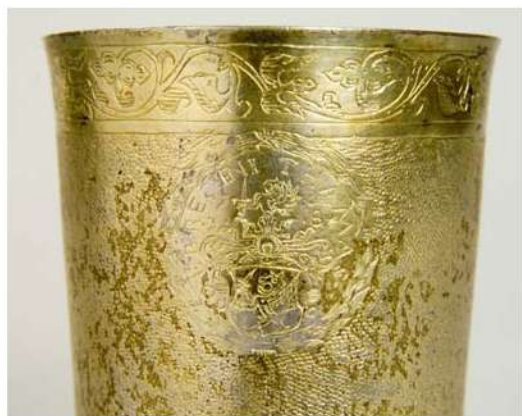
Debreczeni Tamás pohara, 1638 (részlet, Magyar Nemzeti Múzeum, Történeti Tár)

Debreczeni Tamás tokaji prefektusságától kezdve (ki-mutathatóan) a peregrinus diákok egyik jeles pártfogója volt. Tornai P. Ferenc marburgi tanuló 1618-ban ajánlotta neki egyik munkáját, Tornai P. Gáspár 1628-ban, Leidenben megjelent disputációját dedikálta neki. Az egyházat pártoló és segítő intézkedései közismertek voltak, ennek bizonyosságként hozhatjuk fel Milotai (Nyilas) Istvánt, aki 1617-ben Debreczenben napvilágot látott Az mennyei tudomány szerint való irtóvány... című könyvét Debreczeninek dedikálta, mint Az Isten Anyaszentegyházának kegyes patrónusának . Később, 1637-ben, már pataki prefektus, amikor a puritánus Iratosi T. János Az ember életének boldogul való igazgatásának módjáról című Perkins-fordítását ajánlotta neki. Végül, de nem utolsósorban Fröhlich Dávid európai híró természettudósunk egy 1644-ben kiadott öröknaptárát ajánlotta Debreczeni Tamásnak mint patrónusának.